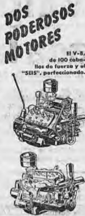
Esta fuerza motriz económica pone más Camiones Ford, en más usos, en todo el mundo.

Con un Camión Ford economiza Ud. en cada carga. Ordene el suyo ahora para que le sea entregado con prontitud.