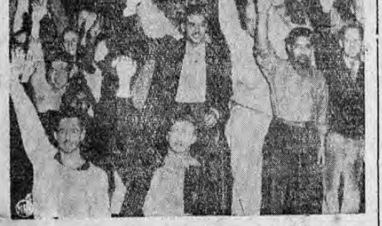
ESTA GRAFICA muestra a los miembros de la Unión Nacional de Marineros en el momento en que votan el arreglo a que se llegó en Washington para solucionar la huelga a que ellos están dispuestos a ir. Con los brazos en alto, los concurrentes votan a favor del arreglo efectuado.

También le preguntamos si iba a contestar un artículo que publicó LA TRIBUNA, contra el "PASA a la pág. 4, col. 4"