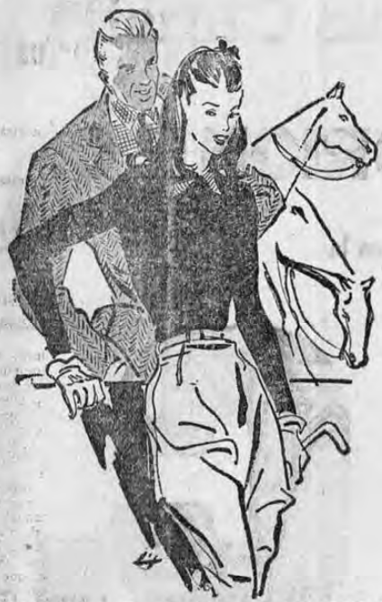
Deliciosa y Encantadora LAVANDA!

LA Suntuosa Boda de Est a Tarde Quesada - Arce